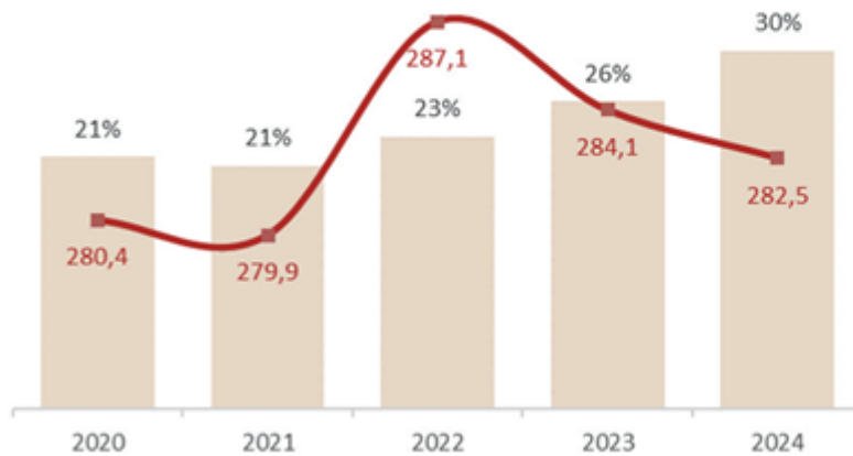
Porcentaje de novillos a faena que aporta el feedlot y promedio general de peso por res.

Porcentaje de novillos trasladados a faena provenientes de feedlots y peso medio obtenido en la faena total de la categoría (kilos equivalente res con hueso).w